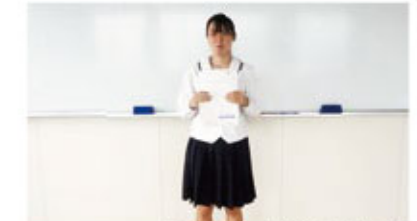
英語検定準1級合格者(在校生)