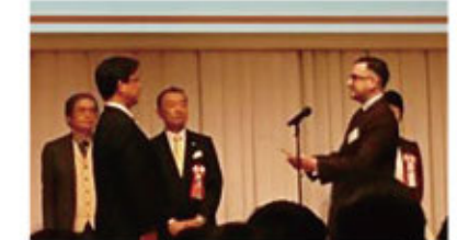
ブリティッシュカウンシル駐日代表賞