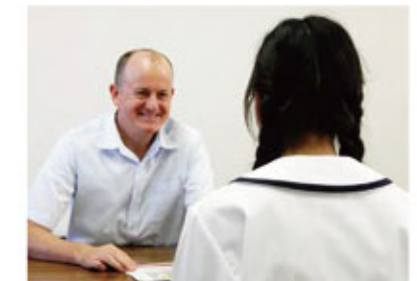
ネイティブ講師による個人指導